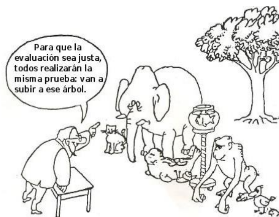
Ilustración cortesía de Miguel Ángel Santos Guerra

4. La paciencia y aplazar lo placentero. Muchos jóvenes no acaban la ESO debido quizás a un motivo: no les gusta estudiar y se inclinan por el placer inmediato (salir con sus amistades, jugar a la playstation, etc.). La obtención del título de la ESO, por ejemplo, es algo que está lejos para ellos, acostumbrados a obtener satisfacciones rápidas que son las que realmente los motivan a la acción. La familia debe esforzarse por educar a sus hijos e hijas en saber aplazar la satisfacción, el placer, y con esto conseguiremos una cosa muy importante que es tolerar la frustración, aceptarla como algo inherente a la vida. Los jóvenes deben saber aceptar que no siempre se consigue de forma inmediata lo que uno quiere, y que deben saber aceptar el "no" por respuesta.